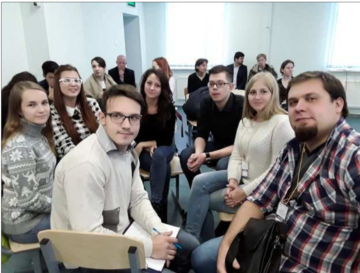
Рис. 25. Команда Курского государственного медицинского университета — участница Школы молодого психолога (14.10.2017, ПСПбГМУ им. акад. И.П. Павлова).

Студенческим командам вузов представилась возможность попробовать свои силы, участвуя в интеллектуальной викторине «Игры разума». Каждой команде предлагалось выбрать одну из областей психологического знания — история психологии, психосоматика, нейропсихология, патопсихология, психотерапия — и ответить на непростые вопросы. Молодежная викторина «Игры разума», яркое выступление капустной команды студентов I-го Меда, вечерние лекции известных ученых на полях конференции и многое другое по-настоящему захватили всех участников и создали атмосферу дружной и продуктивной работы, творческого полета, горячих дискуссий и сотрудничества. Формат Школы молодого психолога был единодушно принят всеми участниками, и было предложено проводить подобное мероприятие ежегодно.