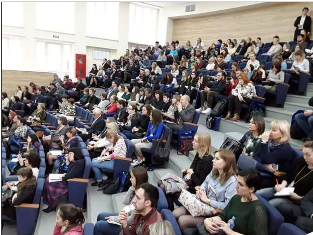
Рис. 2. Пленарное заседание в зале ПСПбГМУ им. акад. И.П. Павлова.

12—14 октября 2017 г. Первый Санкт-Петербургский государственный медицинский университет имени академика И.П. Павлова совместно с российскими, зарубежными партнерами и сетевым научным журналом «Медицинская психология в России» провёл IV Международную научно-практическую конференцию «Медицинская (клиническая) психология: исторические традиции и современная практика».