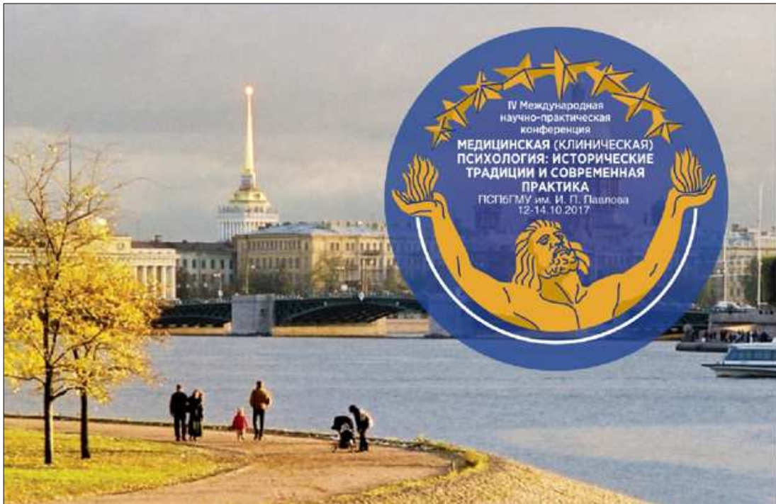
Рис. 1. Эмблема конференции.

12—14 октября 2017 г. Первый Санкт-Петербургский государственный медицинский университет имени академика И.П. Павлова совместно с российскими, зарубежными партнерами и сетевым научным журналом «Медицинская психология в России» провёл IV Международную научно-практическую конференцию «Медицинская (клиническая) психология: исторические традиции и современная практика».